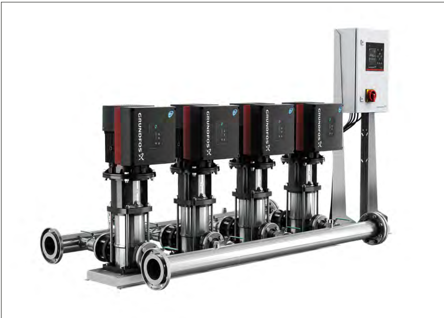
Die Druckerhöhungsanlage Hydro MPC von Grundfos.

zu definieren. Sowohl für unsere Kunden auch als für uns – je nach Kundenwunsch», betont die Geschäftsführerin.